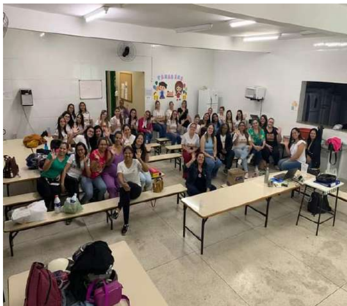
Foto da Formação

Atividades/ Ações Realizadas: Aniversariantes do mês de Agosto.